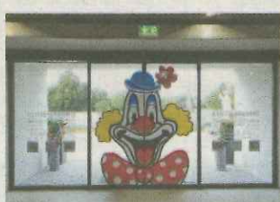
Deiters-Shops bald bei uns?

Betroffen s iPhones mit d Betriebssystem iOS 9 und Fing abdrucksensor. Wird der Hom Button ausgetauscht, überprüft das System neuerdings, o